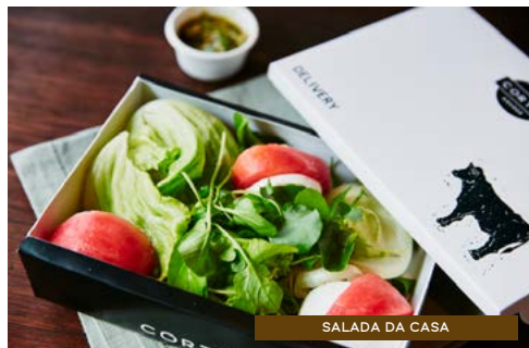
SALADA DA CASA