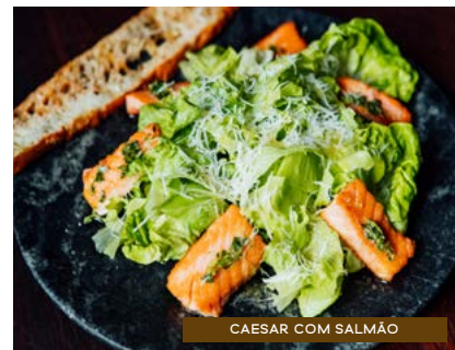
CAESAR COM SALMÃO