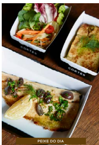
PEIXE DO DIA